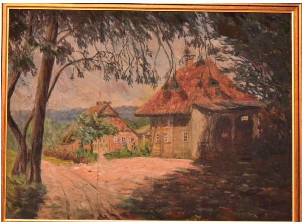
Die Bleecken-Kate Eutiner Straße

Dinge aus der Grundschule Malente, die das ehemalige Schulmuseum aufgelöst hat. Außerdem haben wir von einem Mitglied des Vereins aus einem Nachlass eine ganz tolle Sammlung von Autogramm-Karten von deutschen und internationalen Künstlern übereignet bekommen, die wir zu Geld machen dürfen und somit als Spende den Verein unterstützen.